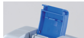
Formschöne und feste Verschlüsse Shapely and solid locks