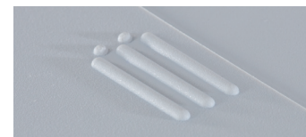
Stapelnocken für sicheres und stabiles Aufeinanderstapeln Stacking feet to enable safe and easy stacking