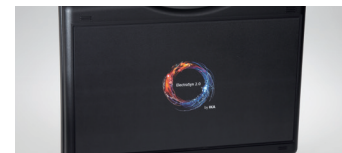
Große Dekorationsfläche für IML und Siebdruck Large decoration area for IML and screen printing