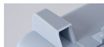
Standfeste und robuste Füße Stable and robust case feet