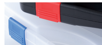
Oberfläche auch in Farbe Transparent verfügbar Surface available in colour transparent